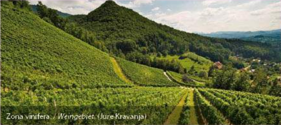
Zona vinifera / Weingebiet. (Jure Kravanja)

Attrazioni / Sehenswürdigkeiten: ROGAŠKA SLATINA: parco delle terme, sala da bere le acque minerali, Museo Anin dvor, Sala dei cristalli, stazione balneare, fattoria della famiglia Junež, cappella di Santa Anna, produzione del vetro cristallo / Kurpark, Trinkhalle der Mineralwässer, Anin dvor Museum, Kristallsaal, Badeanlage, Bauernhof der Familie Junež, Kapelle der hl. Anna, Kakteensammlung, Kristallglasproduktion. CEROVEC POD BOCEM: collezione di cactus, zona vinifera / Kakteensammlung, Weinbergen. BOC: rifugio alpino, torre panoramica, habitat del «fiore di Pasqua», ospedale dei partigiani / Berghütte, Aussichtsturm, Lebensraum der Osterblume, Partisanenkrankenhaus. SPODNJA KOSTRIVNICA: due fontane arredate alle sorgenti dell'acqua minerale (le sorgenti del Re e dell'Ignazio), rastrelliero per il fieno »toplar« con una collezione di oggetti dalla vita contadinesca, chiesa parrocchiale della Santa Madre del Dio di Censtohova / eingerichtete Wasserbrunnen an den Quellen der Mineralwässer (die Königsquelle und die Quelle von Ignatius), Stadel »toplar« mit Sammlung alter Werkzeuge, Kirche der hl. Mutter Gottes von Censtohova.