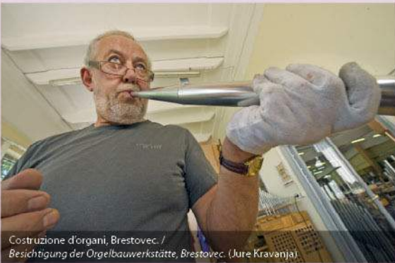
Costruzione d'organi, Brestovec. / Besichtigung der Orgelbauwerkstätte, Brestovec. (Jure Kravanja)

Attrazioni / Sehenswürdigkeiten: PODČETRTEK: castello Podčetrtek, centro antico del borgo, complessi termali, museo dei vecchi oggetti contadineschi / Schloss Podčetrtek, alter Marktkern, Badeanlage, Museum der alten Bauerngegestände. VONARJE: lago di Vonarje / See von Vonarje. BRESTOVEC: visita della costruzione d'organi / Möglichkeiten zur Besichtigung der Orgelbauwerkstätte. SV. EMA: chiesa di Santa Emma e punto panoramico / Kirche der hl. Emma mit Aussichtspunkt.