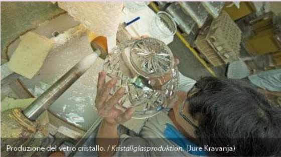
Produzione del vetro cristallo. / Kristallglasproduktion. (Jure Kravanja)

Attrazioni / Sehenswürdigkeiten: ROGATEC: borgo medievale, castello Stmol, chiese di Santa Giacinta e di San Bartolomeo, museo all'aperto Rogatec, vivaio Zabnik / mittelalterlicher Markt, Schloss Stmol, Kirchen der hl. Hyazinthe und des hl. Bartholomäus, Freilichtmuseum von Rogatec, Fischteich Zabnik. SV. FLORJAN: chiesa di San Floriano / Kirche des hl. Florian. ROGAŠKA SLATINA: parco delle terme, sala da bere le acque minerali, Sala dei cristalli, stazione balneare, fattoria della famiglia Junež, cappella di Santa Anna, produzione del vetro cristallo / Kurpark, Trinkhalle der Mineralwässer, Kristallsaal, Badeanlage, Bauernhof der Familie Junež, Kapelle der hl. Anna, Kakteensammlung, Kristallglasproduktion.