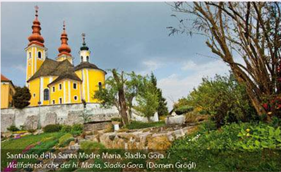
Santuario della Santa Madre Maria, Sladka Gora. / Wallfahrtskirche der hl. Maria, Sladka Gora. (Domen Grögl)

Attrazioni / Sehenswürdigkeiten: SMARJE PRI JELŠAH: castello Jelše, parco del castello, chiesa di San Rocco con il Calvario (punto panoramico), Museo di barocco / Schloss Jelše, Schlosspark, Kirche des hl. Rochus mit dem Kreuzweg (Aussichtspunkt), Barock Museum. MOČLE: chiesa di San Lorenzo / Kirche des hl. Laurentius. SLADKA GORA: santuario della Santa Madre Maria e zona vinifera / Wallfahrtskirche der hl. Maria, Weingebiet. LEMBERG: borgo medievale, colonna infame, ex-municipio, le chiese di San Pancrazio e di San Nicolò / mittelalterlicher Markt, Pranger, ehemaliges Rathaus, Kirchen des hl. Pankracius und des hl. Nikolaus. NUMEROSI COSTRUZIONI DELLA EREDITÀ ETNOLOGICA / ZAHLREICHE OBJEKTE AUS DER ETHNOLOGISCHEN ERBSCHAFT (case, rastrellieri per il fieno, fattorie, cantine di vino / Häuser, Städel, Scheunen, Weinkeller).