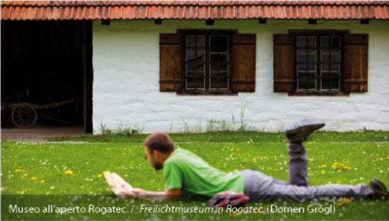
Museo all'aperto Rogatec. / Freilichtmuseum in Rogatec. (Domen Grögl)

Attrazioni / Sehenswürdigkeiten: ROGATEC: borgo medievale, castello Stmol, chiese di Santa Giacinta e di San Bartolomeo, museo all'aperto Rogatec, vivaio Zabnik / mittelalterlicher Markt, Schloss Stmol, Kirchen der hl. Hyazinthe und des hl. Bartholomäus, Freilichtmuseum von Rogatec, Fischteich Zabnik. LOG: riserva forestale Log ob Sotli, cava dell'arenaria selciosa (tradizione di tagliapietre) / Jagdreservat Log am Fluss Sotla, Steinbrüche des Kiesel sandsteines (Steinmetztradition). DOBOVEC: chiesa di San Rocco lungo il Sotla, terreno dell'andesite (curiosità geologica) / Kirche des hl. Rochus am Fluss Sotla, kahle Fläche aus Andesit (geologische Sehenswürdigkeit). TRLIČNO: lago Majdan / See Majdan.