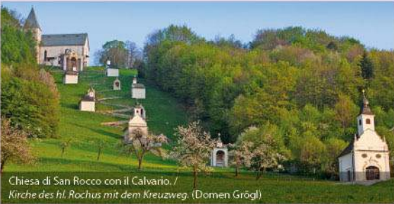
Chiesa di San Rocco con il Calvario. / Kirche des hl. Rochus mit dem Kreuzweg. (Domen Grögl)

Attrazioni / Sehenswürdigkeiten: SMARJE PRI JELŠAH: castello Jelše, parco del castello, chiesa di San Rocco con il Calvario (punto panoramico), Museo di barocco / Schloss Jelše, Schlosspark, Kirche des hl. Rochus mit dem Kreuzweg (Aussichtspunkt), Barock Museum. STRTENICA: fattoria della famiglia Sedovšek (monumento etnologico) / Bauernhof der Familie Sedovšek. GOLA DI LOČNICA / SCHLUCHT LOČNICA: valle intatta di fiume / erhaltengebliebenes Flusstal. TINSKO: chiesa di Sant'Anna e della Madre del Dio (punto panoramico), zona vinifera / Kirche der hl. Anna und der hl. Mutter Gottes (Aussichtspunkt), Weingebiet. NUMEROSI COSTRUZIONI DELLA EREDITÀ ETNOLOGICA / ZAHLREICHE OBJEKTE AUS DER ETHNOLOGISCHEN ERBSCHAFT (case, rastrellieri per il fieno, fattorie, cantine di vino / Häuser, Städel, Scheunen, Weinkeller).