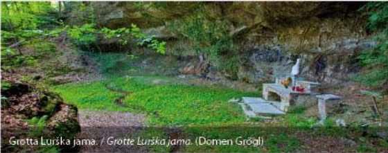
Grotta Lurška jama. / Grotte Lurška jama. (Domen Grögl)

Inizio / Anfang: Smarje pri Jelšah. Lunghezza / Länge: 23 km (percorso circolare / Rundweg). Percorso / Ablauf: Smarje pri Jelšah – castello / Schloss Jelše – Močle – Sotensko – Nova vas – Sladka Gora – Jerovska vas – Lemberg – Preloge – Smarje pri Jelšah.