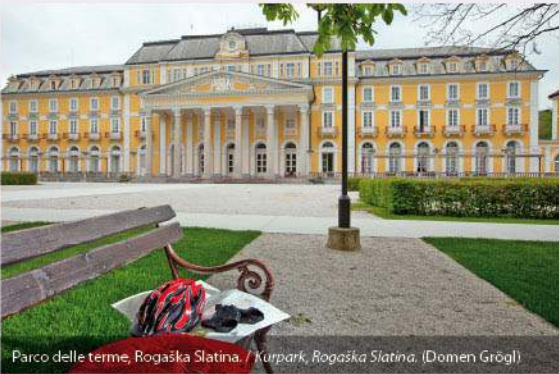
Parco delle terme, Rogaska Slatina. / Kurpark, Rogaska Slatina. (Domen Grögl)

Attrazioni / Sehenswürdigkeiten: ROGAŠKA SLATINA: parco delle terme, sala da bere le acque minerali, Museo Anin dvor, Sala dei cristalli, stazione balneare, fattoria della famiglia Junež, cappella di Santa Anna, produzione del vetro cristallo / Kurpark, Trinkhalle der Mineralwässer, Anin dvor Museum, Kristallsaal, Badeanlage, Bauernhof der Familie Junež, Kapelle der hl. Anna, Kakteensammlung, Kristallglasproduktion. VONARJE: lago di Vonarje / See von Vonarje. KRISTAN VRH: chiesa di San Pietro / Kirche des hl. Peter.