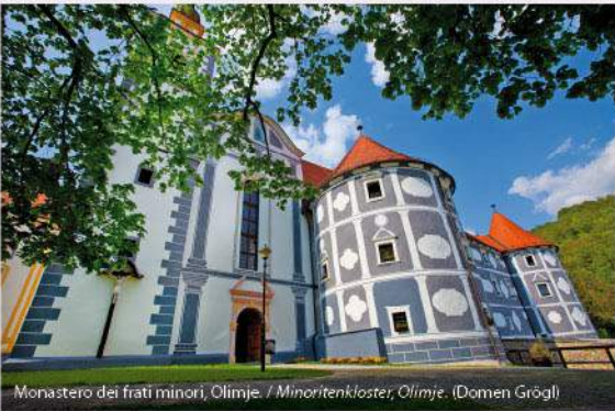
Monastero dei frati minori, Olimje. / Minoritenkloster, Olimje. (Domen Grögl)

Attrazioni / Sehenswürdigkeiten: PODČETRTEK: castello Podčetrtek, centro antico del borgo, complessi termali, museo dei vecchi oggetti contadineschi, torre panoramica su Mala Rudnica, bivacco di caccia, lago su Olimska gora / Schloss Podčetrtek, alter Marktkern, Badeanlage, Museum der alten Bauerngegestände, Aussichtsturm auf Mala Rudnica, Jägerhütte, See auf Olimska gora. OLIMJE: chiesa di Santa Maria Assunta, monastero dei frati minori, antica farmacia, orti del monastero, percorso didattico attraverso il monte Rudnica – Virštanj, chiesa di Santa Maria sulla Sabbia / Kirche der hl. Maria Himmelfahrt, Minoritenkloster, Klosterapotheke, Klostergärten mit Heilkräutern, geologischer Lehrpfad Rudnica – Virštanj, Kirche der hl. Maria auf dem Sand.